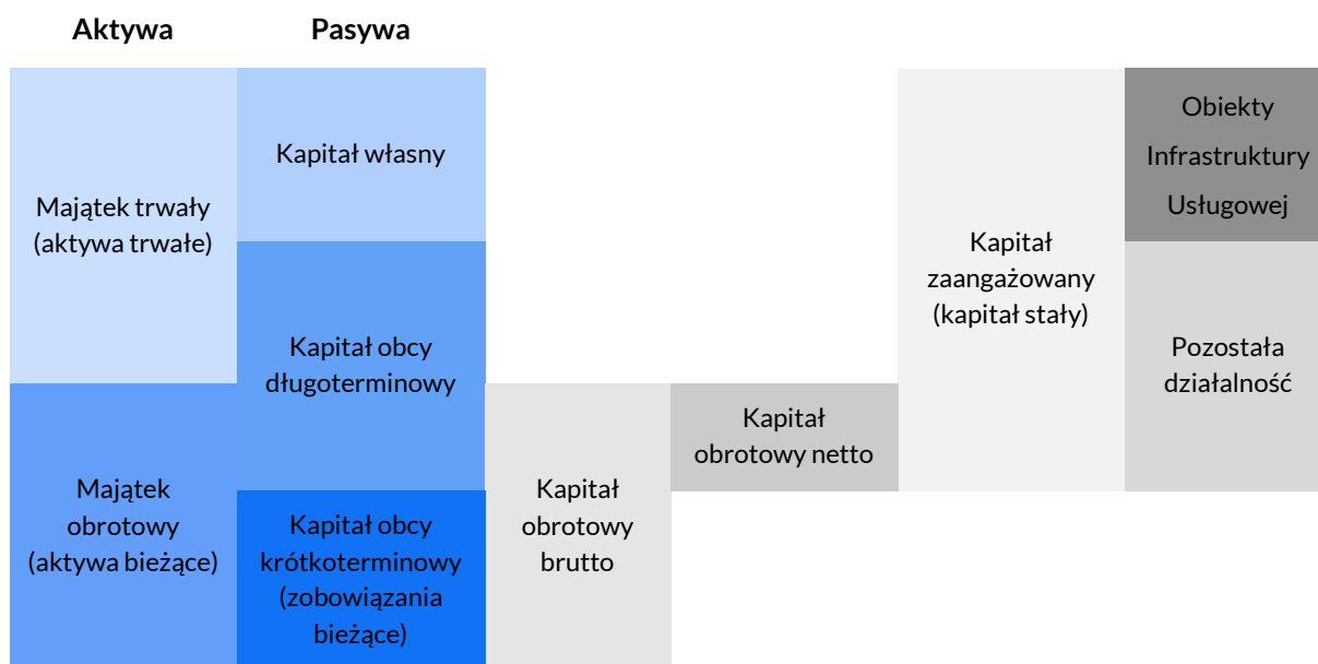
Schemat 1. Kalkulacja kapitału zaangażowanego